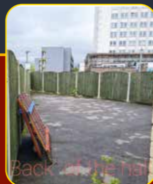
Back of the hall