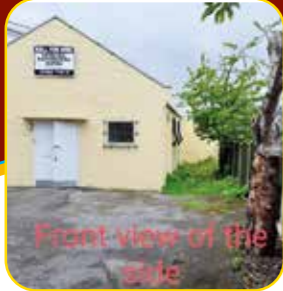
Front view of the hall