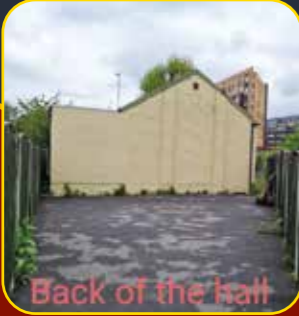
Back of the hall