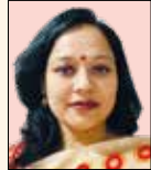
Mrs Bappy Dam Joint Cultural Secretary